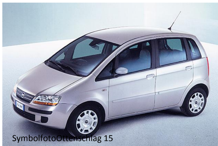
Symbolfoto Ottenschlag 15

Fiat Idea Turbo Diesel Bj. 2004 70 PS Farbe mittel rot KM 148 000 2. Besitzer Picker bis 12/2017, 8-fach Bereifung inkl. Felgen Josef Primetshofer 4372 St. Georgen/Wald Tel. 07954/26607 Preis: 2 900€